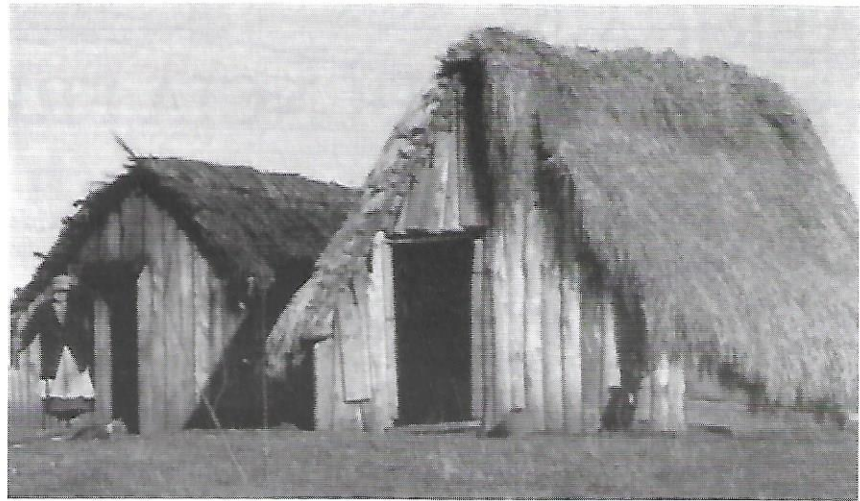
La "ruca": habitatge dels Mapuches al sud de Xile

El govern demòcrata cristià del president Eduard Frei dona suport obertament al consorci ENDESA que planeja construir cinc centrals hidroelèctriques al Biobío, el riu més caudalós i important del país, obligant a les comunitats indígenes pehuenches a abandonar aquestes terres en els sectors de la preserrallada dels Andes i que ocupen des d'abans de l'arribada dels espanyols a Amèrica.