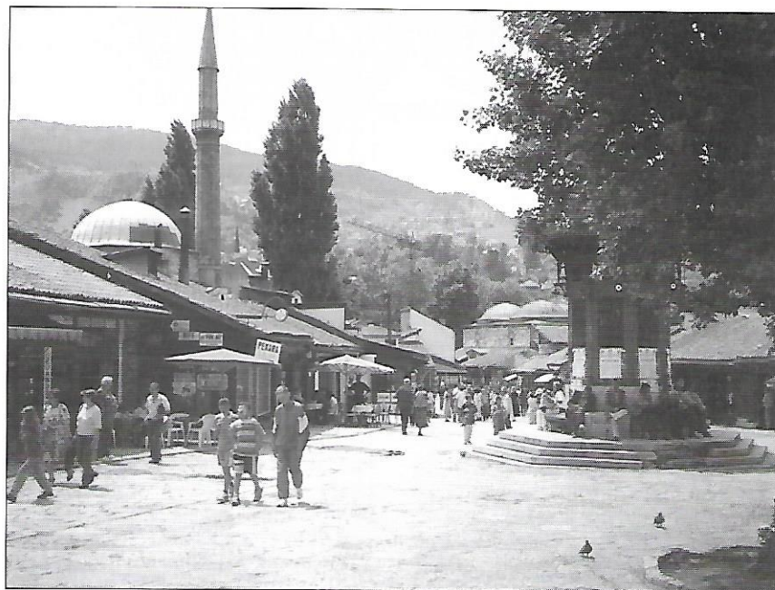
Barri turc de Sarajevo. La ciutat intenta viure un ambient de normalitat.

En aquest sentit, la delegació sabadellenca va poder comprovar sobre el terreny que un any i mig després dels acords Dayton la situació que es viu a Bòsnia no és de pau sinó de "no guerra" (presència massiva de forces de l'ONU, fronteres impermeables, ciutats i pobles dividits, criminals de guerra en llibertat,...) i que les conseqüències del conflicte són encara duríssimes (alt índex de mortalitat a causa de