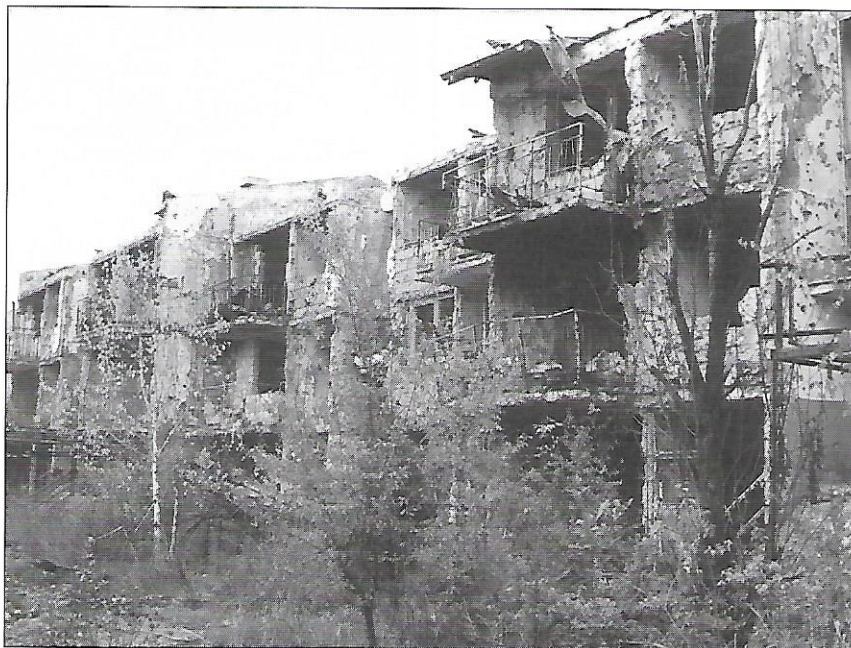
Barri de Dobrinja a Sarajevo

El projecte del Grup Bòsnia de la Lliga de realitzar un intercanvi cultural entre joves de Sabadell i Sarajevo ja és una realitat. Un grup de 25 joves de Sabadell viatjarà a Sarajevo del 5 al 16 de juliol per conèixer i intercanviar experiències amb els joves del barri de Dobrinja, un dels més castigats per la guerra. Les activitats que s'hi duran a terme són molt diverses: des de la presentació de la ciutat de Sabadell -des del punt de vista d'activitats, entitats i grups de i per joves- passant per dos concerts de rock, en què hi participaran el grup sabadellenc Supersonics i grups de rock bosnians, a tallers de perruqueria, maquillatge i fotografia, actuacions de danses al carrer, excursions i actes lúdics de tot tipus. Totes aquestes activitats tenen el mateix objectiu: potenciar el paper de l'Euroclub al barri, donar-lo a conèixer a tots els joves de la zona i engrescar-los a participar-hi.